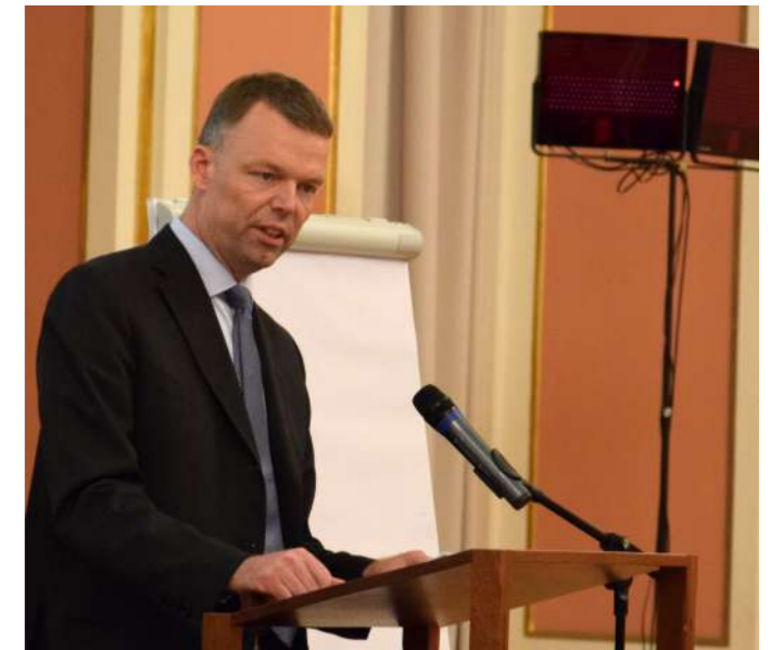
А.Хуг, в минулому Заступник Голови Спеціальної моніторингової місії ОБСЄ у східній Україні